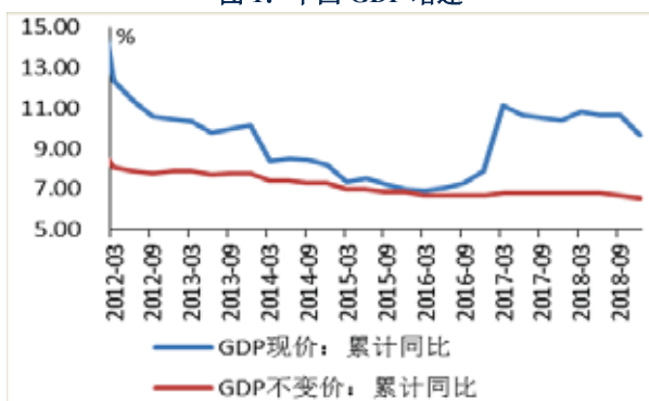
图 1：中国 GDP 增速

2018 年，在内部去杠杆和外部贸易冲突的双重压力下，中国经济运行稳中有变，GDP 增速逐季回落，全年 GDP 同比增长 6.6%，虽然达到预期目标，但较上年回落 0.2 个百分点。展望 2019 年，高杠杆下经济转型所面临的阵痛持续，政策托底力度依然有限，供需两端仍有放缓压力，预计全年 GDP 增长 6.3%，上半年下行压力较大，下半年随着“稳增长”政策效果显现或略有企稳。