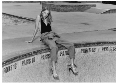
I R O PARIS