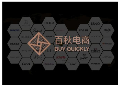
百秋电商 Buy Quickly