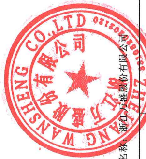
2018年度非经营性资金占用及其他关联资金往来情况汇总表