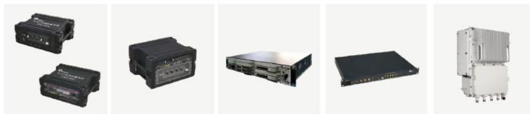
分体式快速部署系统 SRD1000