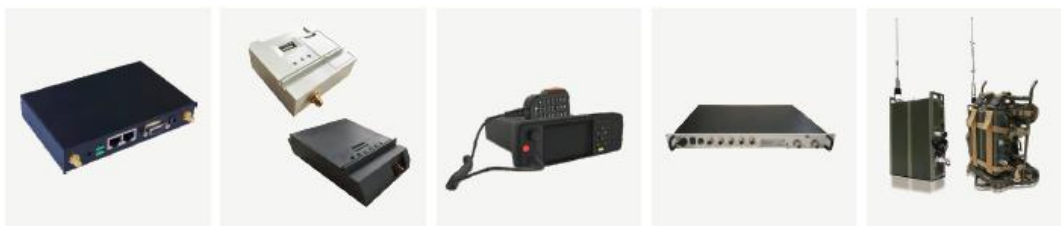
MEM 模块 MEM130