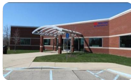
美国安娜堡-密西根分部