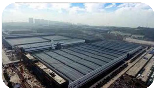
中国重庆-金康数字化工厂

公司收购美国AM General LLC公司民用汽车工厂，作为公司在美国的高端智能制造基地；在国内，公司子公司重庆金康新能源汽车有限公司获得纯电动乘用车生产资质，金康数字化工厂建设项目工作有序推进。两地工厂同步采用工业4.0标准。