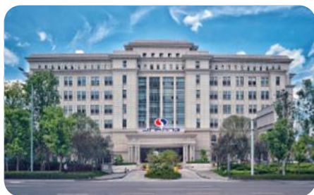
中国重庆-金康新能源总部