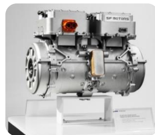
SF SEP400 交流感应电机