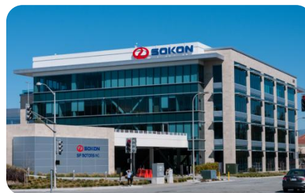
美国硅谷-美国总部、研发中心