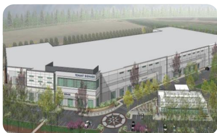
美国硅谷-硅谷实验室