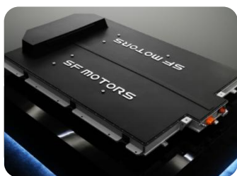
SF 高能量密度电池包