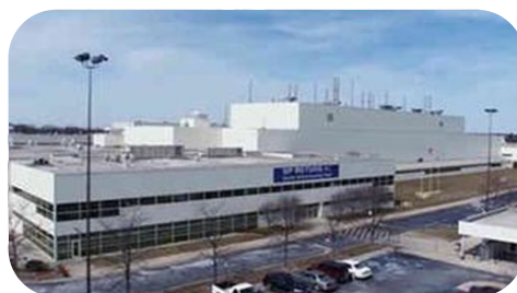
美国印第安纳-SF美国工厂