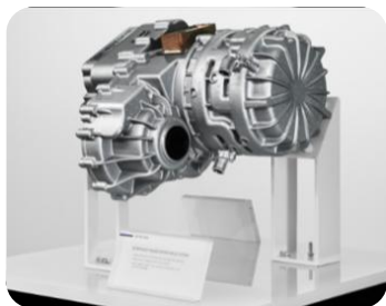
SF SEP100 交流感应电机