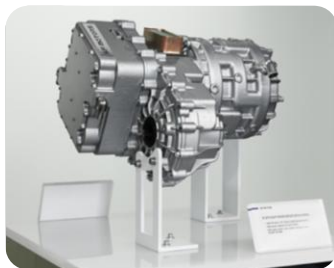
SF SEP200 交流感应电机