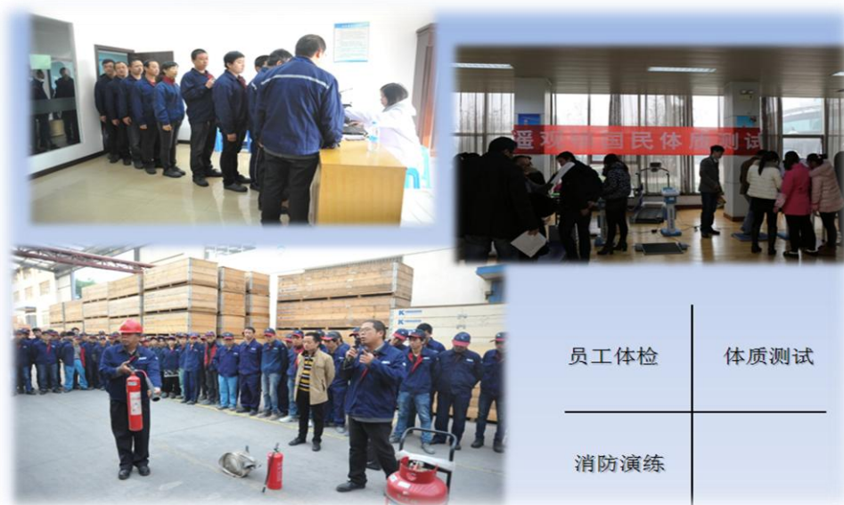
员工健康、安全项目活动

公司将以人为本的理念放在首位，建立了一套关爱员工、善待员工、培养员工、提升员工能力的标准化流程。公司设有《职业病预防管理制度》、《体检管理程序》等多项措施和办法，对职业病进行监控，定期组织员工进行职业病体检，确保员工身心健康。员工健康。