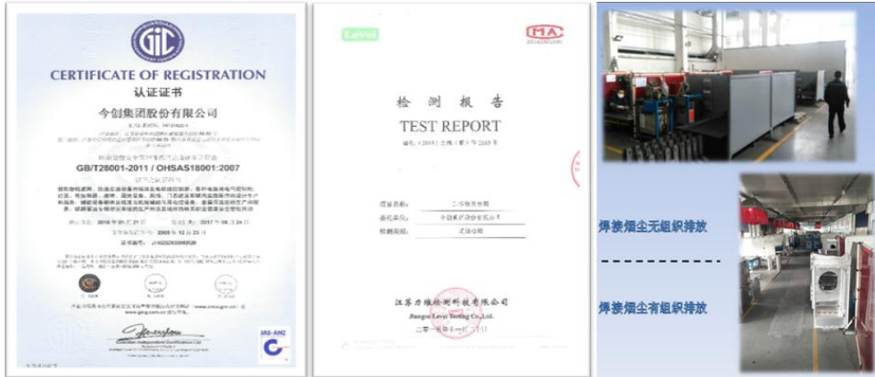
环境安全认证证书、监测报告

公司将以人为本的理念放在首位，建立了一套关爱员工、善待员工、培养员工、提升员工能力的标准化流程。公司设有《职业病预防管理制度》、《体检管理程序》等多项措施和办法，对职业病进行监控，定期组织员工进行职业病体检，确保员工身心健康。员工健康。