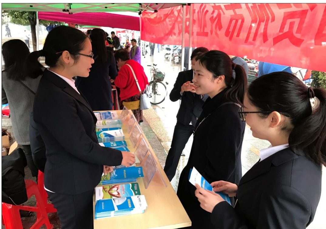
公司青年员工进行安全用电宣传和业务办理流程讲解

为了加强用户的安全用电意识，保障市民日常用电安全，公司积极开展供电、用电服务宣传，不定期举行“安全生产宣传咨询日”等活动。公司营销部与客户服务中心等部门多次组织相应岗位人员及公司青年志愿者，通过制度上墙、客户调研、设立咨询服务台、宣传展板等多种形式向当地市民宣传用电常识、缴费途径以及电力政策、电力法律法规，解答客户用电咨询，受理客户投诉，增加客户对公司的了解度和认可度。同时，公司继续施行“银电合作”政策，向客户提供方便快捷的缴费方式，由银行代扣代交电费，真正做到利民、便民、省时、省力。