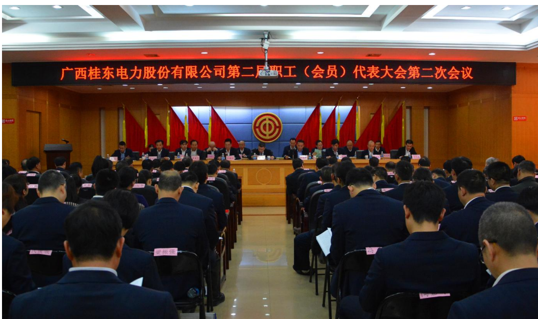
桂东电力第二届职工（会员）代表大会第二次会议圆满召开

除依据《公司法》和《公司章程》的规定选举职工监事、职工董事，确保职工在公司治理中享有的合法权利外，公司还成立了职代会提案审理督办工作委员会，通过组织召开“提案审查督办工作会议”或职工代表座谈大会的形式，对职代会的提案及建议进行汇总、审查，对工资、福利、劳动安全卫生、社会保险等涉及职工切身利益的事项，听取职工意见和建议，认真做好提案反馈督办工作。司务公开工作稳步推进，把企业改革发展难点、职工关注的热点、企业廉政建设的关键点作为司务公开的重点，不断提高司务公开工作制度化、规范化水平，让职工享有充分的知情权、监督权。