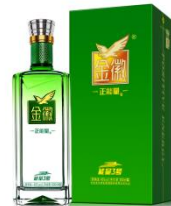
正能量-能量 3 号