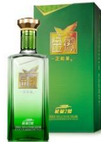
正能量-能量 2 号