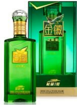
正能量-能量 1 号