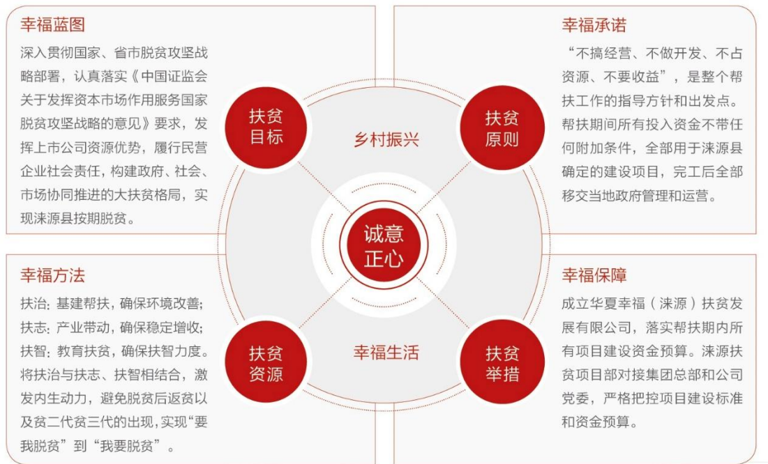
华夏幸福“四位一体”精准扶贫模式

华夏幸福围绕 2020 年涞源县脱贫的目标，探索实施华夏幸福“四位一体”精准扶贫模式，通过积极引导、广泛动员，激发群众脱贫的内生动力，形成政府主导、企业帮扶、全民参与、多维联动的脱贫攻坚新格局。