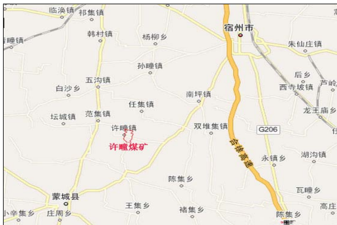
(图1. 交通位置示意图)

矿井北端与童庄井田毗邻,南端至板桥断层,西北与界沟煤矿相邻,浅部止于采矿许可的矿界,深部以32煤层-800m底板等高线的水平投影线和采矿许可的边界为界,与赵集、许疃深部勘查区相邻。走向长约9~12km,宽约3~7km(见交通位置示意图)。