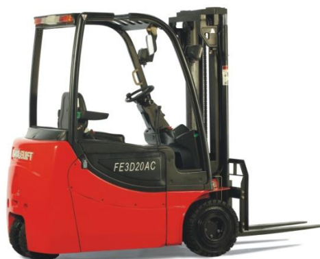
电动平衡重乘驾式叉车

上述产品均是以蓄电池或人力为动力的搬运、仓储和装卸类车辆，是物流行业的重要装备，在国民经济各行业的物料装卸、搬运、仓储等环节广泛应用。