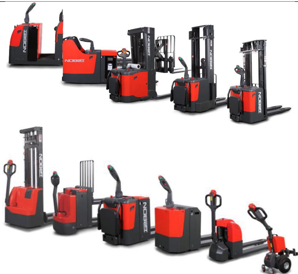
电动乘驾式仓储叉车