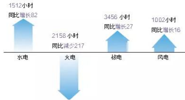
2015上半年全国发电设备累计平均利用小时

发电量更是在十几年来第一次出现了负增长。2015年上半年全国发电设备累计平均利用小时情况如下：