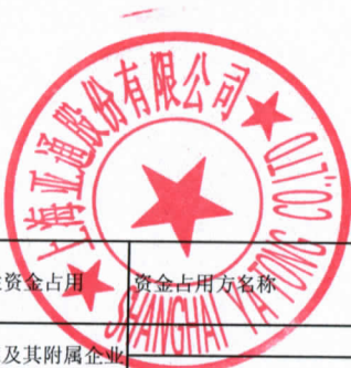
亚通公司2015年度非经营性资金占用及其他关联资金往来情况汇总表