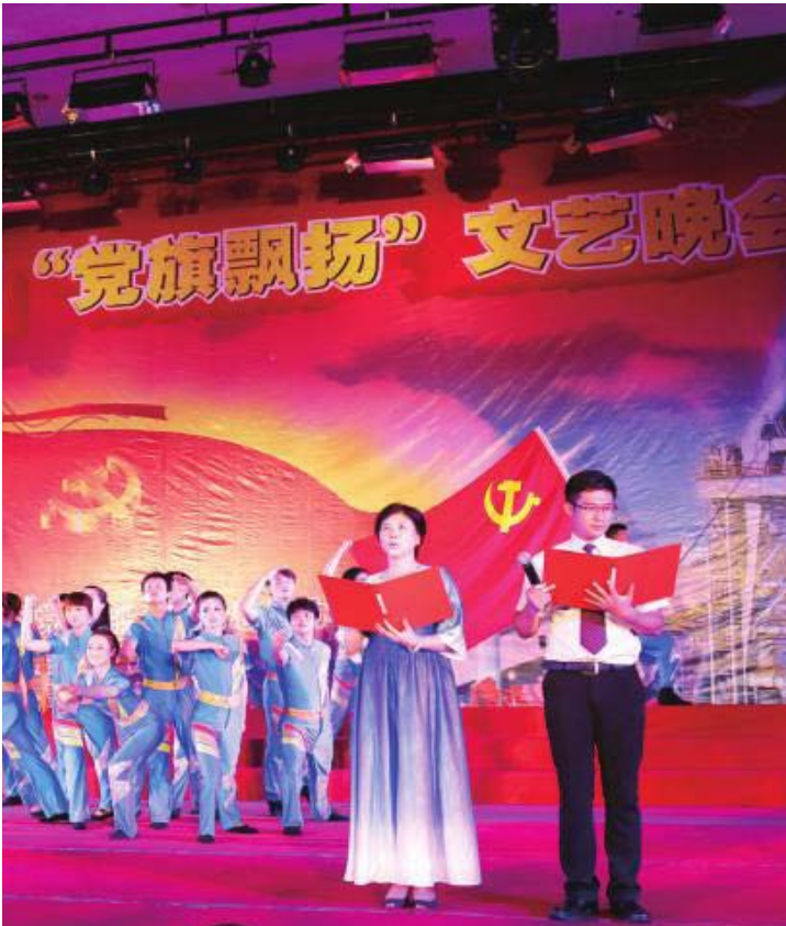
2014 年柳钢“党旗飘扬”文艺晚会