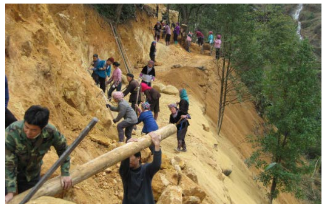
帮助公司扶贫点融水县开山路

近年来，柳钢青年志愿者以实际行动积极践行“奉献、友爱、互助、进步”的志愿服务精神，持续开展各类青年志愿者服务活动，仅在2014年就开展各类青年志愿服务活动68次，参与青年志愿者1184人次，服务时间累计3275小时，打造了“柳钢青年周末志愿服务广场”、“柳钢青年文明号‘爱心全覆盖’活动”、“柳钢青年岗位学雷锋活动”等一批青年志愿服务工作品牌，有效引导广大团员青年积极践行社会主义核心价值观，在构建和谐企业、推进柳钢志愿服务工作中贡献青春力量。