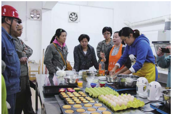
工会举办“玩转烘焙 DIY、乐享慢生活”烘焙初级培训班。培训班由中板厂一位自学烘焙技艺的女职工担任教师，在轻松欢快的氛围中教大家制作初级蜂蜜蛋糕的方法，学员们纷纷亲手试制。图为职工现场交流烘焙技艺。

进行慰问，发放防暑降温药茶；给特殊岗位女工小组配备、补充了小药箱，缓解了高温等特殊环境给女职工带来的不适感，两项药品购买共计 45820 元。按照集体合同的规定，全年共给近 3800 名女职工发放保健用品达 148 万元，从根本上保护了女职工的特殊权益。