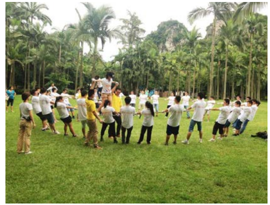
新员工户外拓展活动