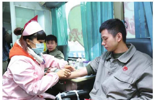
柳钢职工踊跃参加无偿献血活动