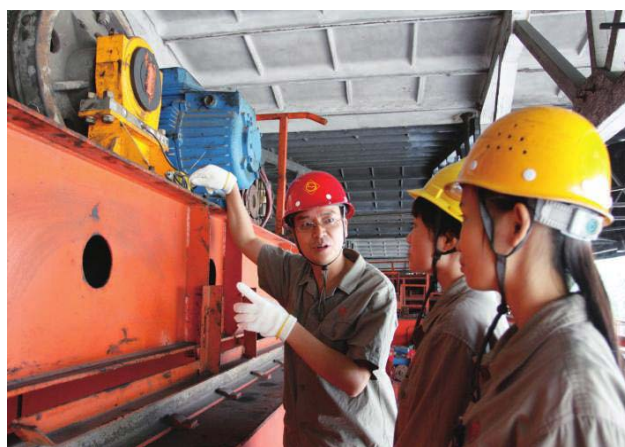
2014年，公司开展以“安全行动、党员先行”为主题的党员身边安全无事故活动，要求每位党员每月开展安全隐患排查，并上交安全检查改善卡，让活动成果真正落到实处。