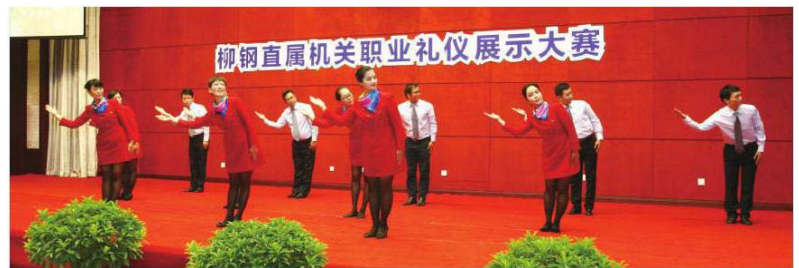
职业礼仪展示大赛