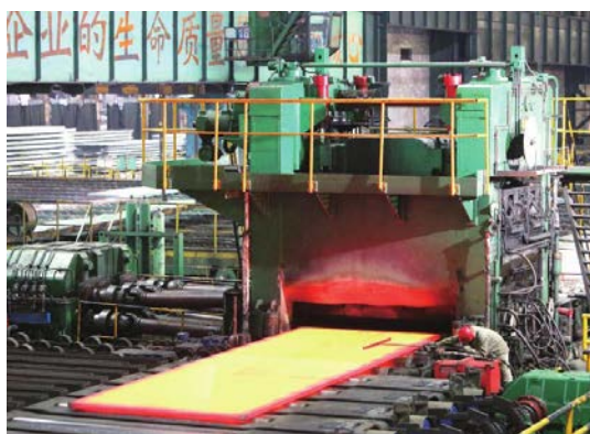
质检员在检测钢板平整度

2014 年公司质量管理工作紧紧围绕公司总体发展思路和降本增效工作重点，创新、细化质量管理，稳定提升产品质量，推进柳钢品牌建设，为实现强优柳钢夯实质量管理基础。柳钢荣获“全国质量检验工作先进企业”、“全国质量管理小组活动优秀企业”、“全区用户满意企业”称号。上级部门监督抽查合格率达 100%。无产品质量安全事故发生。