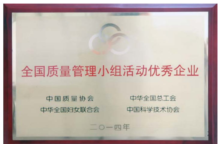
全国质量管理小组活动优秀企业