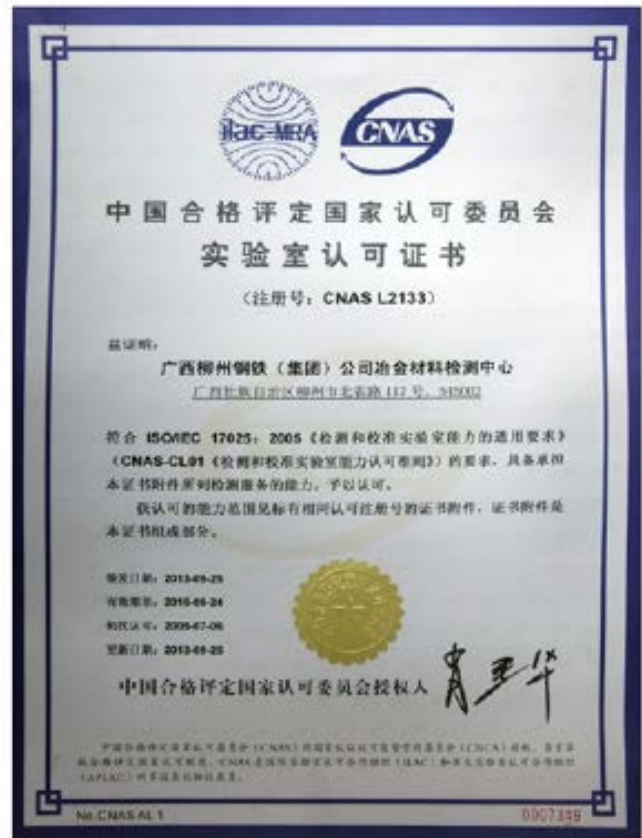
柳钢股份质量体系认证证书、柳钢冶金材料检测中心实验室认可证书