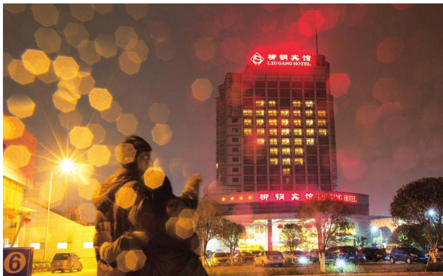
情人节的幸福柳钢人

2015 年任务艰巨，意义重大，我们将进一步增强工作紧迫感和责任感，结合实际，抓住机遇，改革创新，攻坚克难，共同为实现今年各项目标、开创改革发展新局面而努力奋斗！