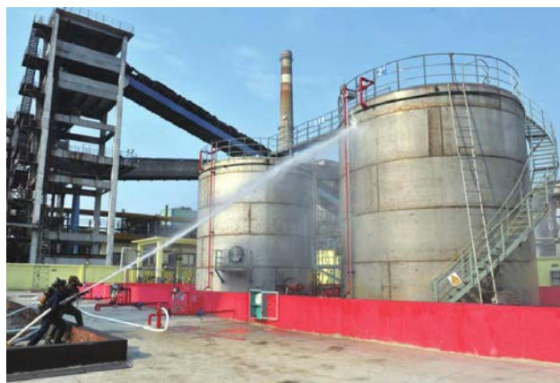
焦化厂在新改造完成的油库区域举行粗苯泄漏着火事故应急演练。演练模拟管道因腐蚀穿漏，发生粗苯泄漏，火势迅速扩散，1名施工人员中毒窒息。接到事故报警后，岗位人员及前来支援的应急小组，按照规程有条不紊地扑灭火灾并救出人员。