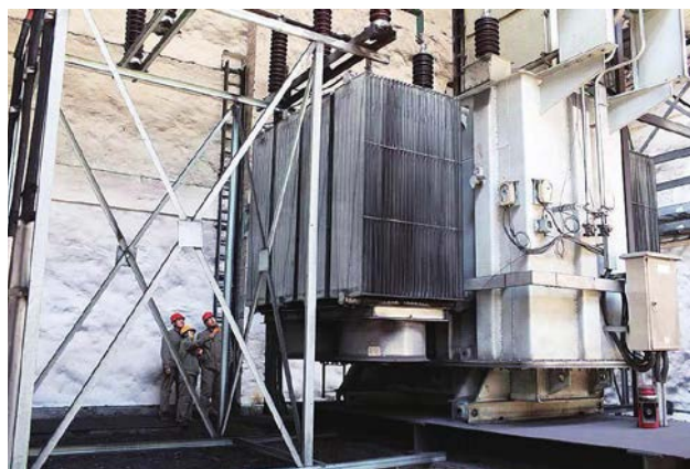
炼铁厂组织人员对电气设施进行拉网式排查，防止高压电气失压造成大面积停电，确保高压电气设备安全运行。图为该厂设备管理人员正在检查电气设施。

(3) 组织公司危化品负责人、安全管理人员参加资格证取证、再教育培训，注册安全工程师再教育培训；举办能量锁定上锁挂牌培训，危险源辨识、风险控制培训，煤气中毒与现场急救知识培训，劳动保护检查员培训，“青安岗”岗长培训，安全管理人员、班组长培训及特种作业人员培训等。