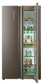
Smart Window 智慧窗冰箱