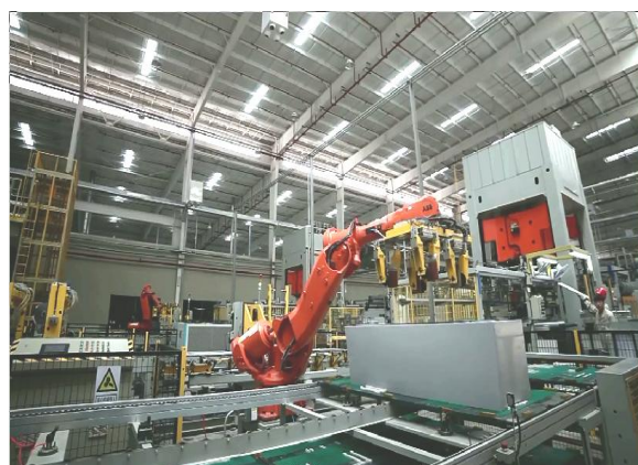
图为：沈阳冰箱智能化 U 壳配送线体