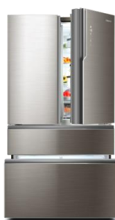
卡萨帝朗度多门冰箱