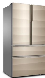
卡萨帝朗度多门冰箱