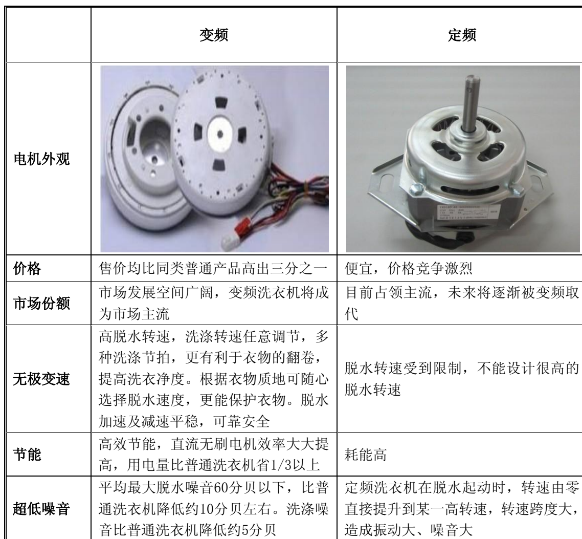
变频与定频洗衣机差异比较表

变频技术作为一项高新技术，顺应行业发展趋势—低碳、绿色、环保、节能，有着广阔的发展空间。