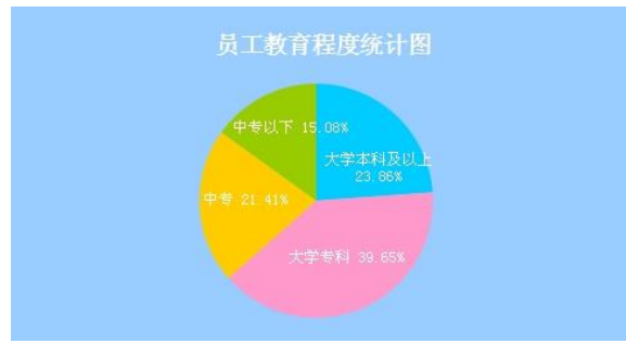
(五) 教育程度统计图: