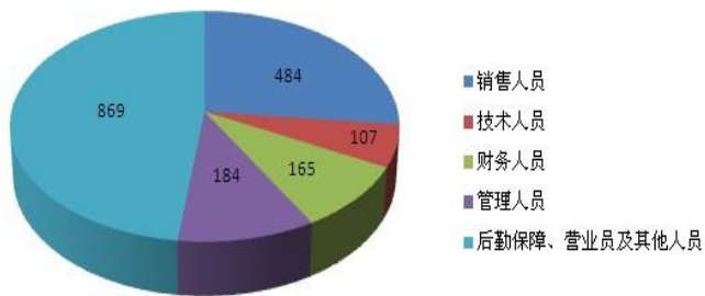
(二) 专业构成统计图