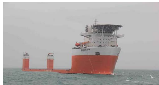
5 万吨半潜式自航工程船首航

此外，公司承担的国家 863 计划“超大型浮式结构物关键技术研究”和“海洋深水浮材的开发与应用”科研课题顺利通过各级专家组验收，为进入深水工程市场提供了技术支持。