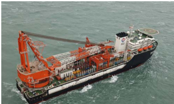
3000 米深水铺管起重船“海洋石油 201”

与此同时，公司积极探索对外合作模式，进一步推动国际合作。目前公司已与几家国际知名石油公司建立了良好合作关系，一些国际石油公司和油气设施工程公司相继到公司制造场地调研、访问，表达了合作意愿。