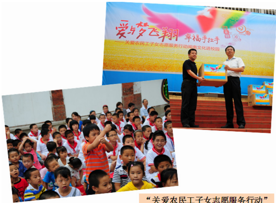
“关爱农民工子女志愿服务行动”

作为省级文明单位，公司常年支助厦门教育、卫生、体育、文化事业，多年坚持开展贫困村扶贫慰问活动，年内，公司再次荣获由福建省红十字会颁发的“人道金质奖章”。