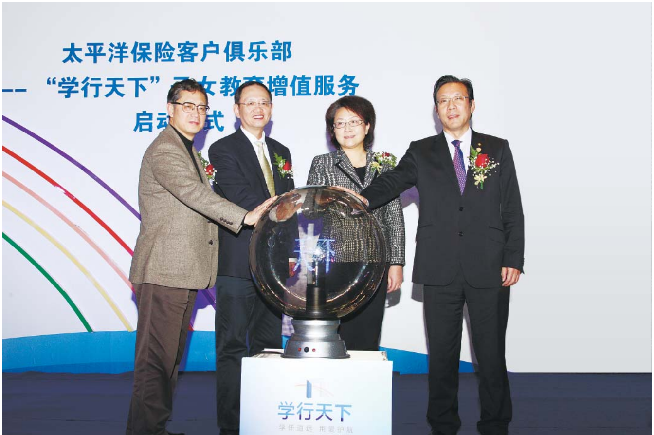
太保寿险推出“学行天下”子女教育增值服务