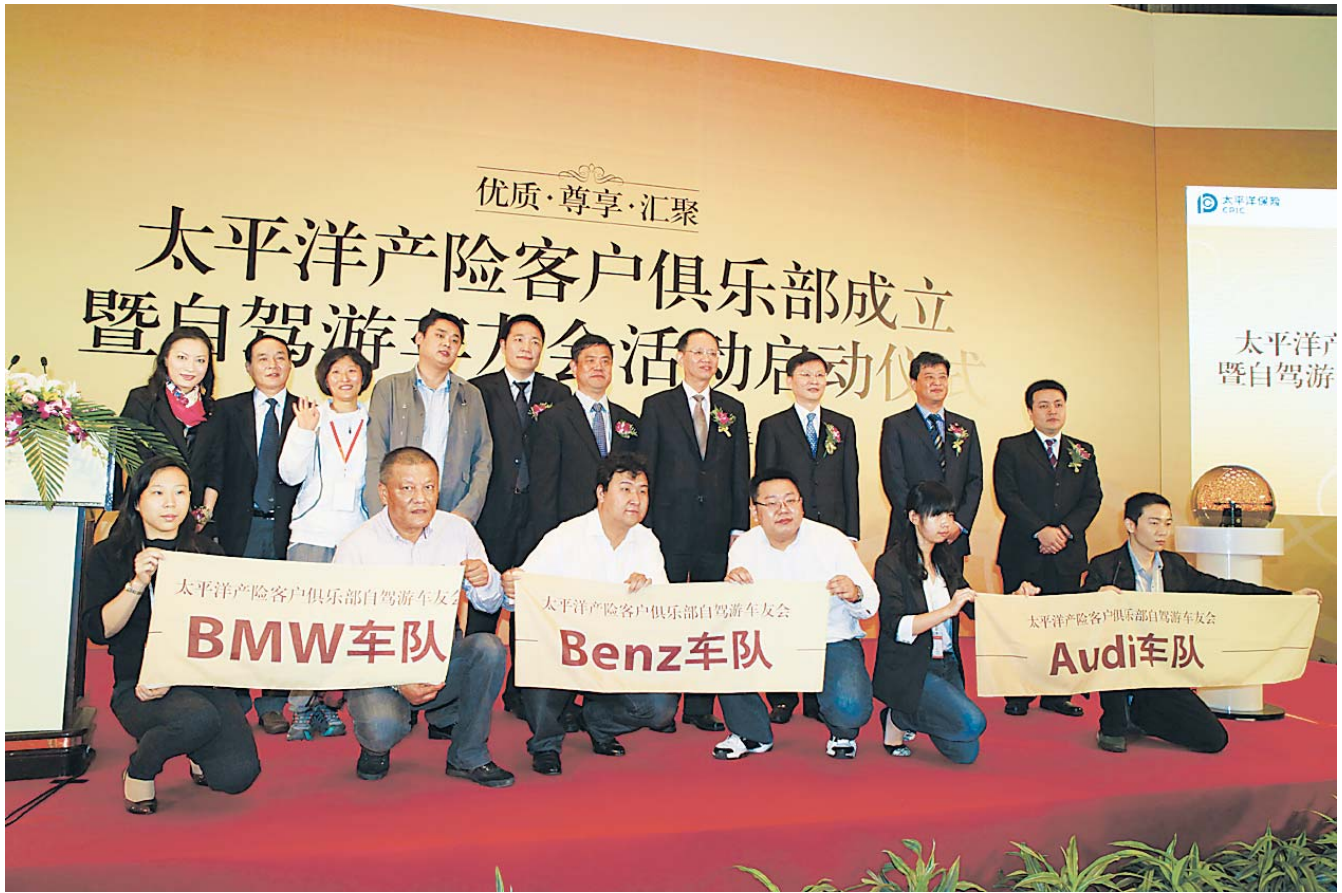
太平洋产险客户俱乐部成立暨自驾游车友会活动启动仪式