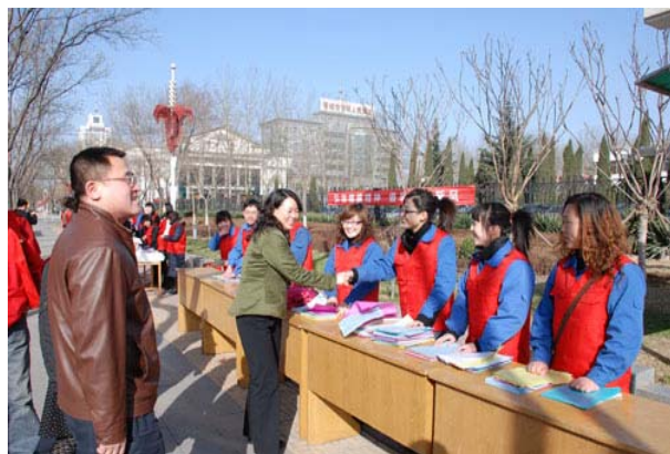
右图为公司青年志愿者参加社会活动

➤ 2009 年 5 月，大阳煤矿分公司开展了“博爱一日捐”活动。此次募捐活动主要用于资助长期生活在贫困线以下的贫特困群体，通过积极的宣传和发动，共收到捐款 48930 元。