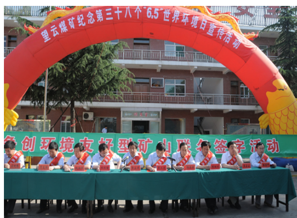
世界环境日开展各种形式宣传活动

➤ 2010 年 1 月，在首届“山西环境保护奖”颁奖典礼上，公司荣获“山西环保减排奖”。