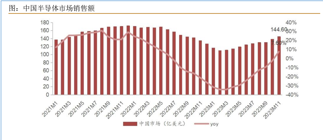
图：中国半导体市场销售额