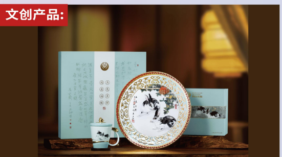
茅台玉兔呈祥工艺盘/马克杯