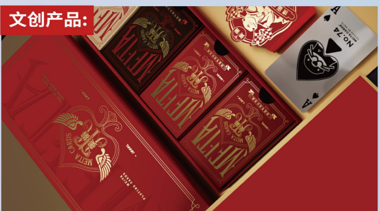
美獭搅蛋专用扑克牌礼盒

在品牌策略规划、创意设计方面，公司多年来积累了丰富的创意设计素材库和设计方法论，并打造