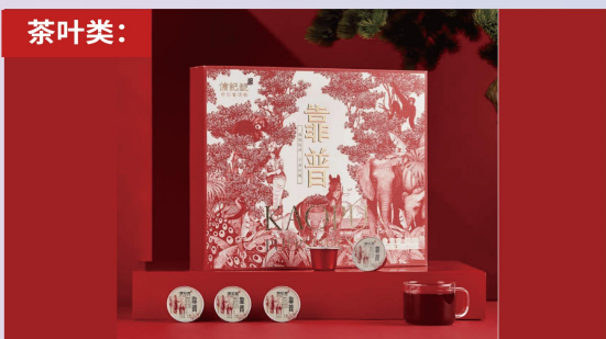
八马“靠谱”好茶礼盒