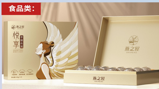
燕之屋悦享零糖燕窝礼盒