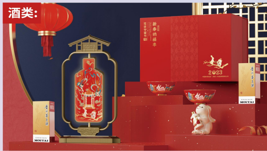
茅台兔年新春礼盒