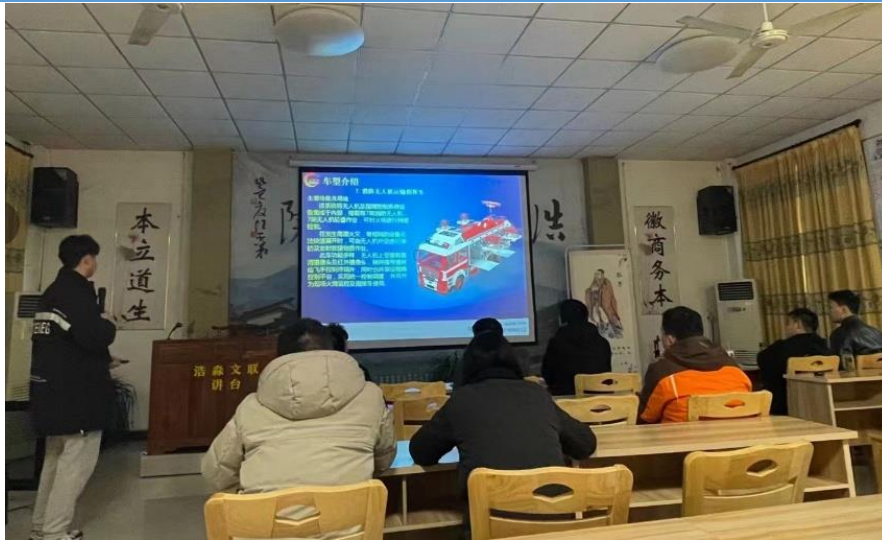
图1 营销人员技能培训道场