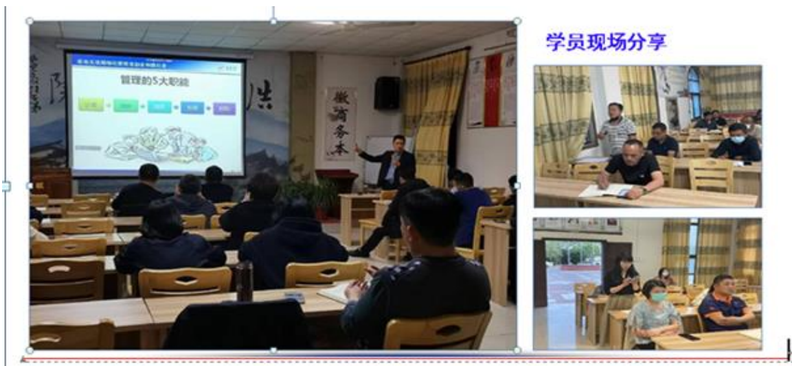
图 7 精益项目组老师培训现场

2022 年参与了经信委组织的各类培训课程，比如《公司运营中的法律风险及防范》、《全面预算管理与成本控制》。