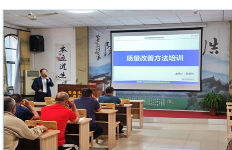
图2 精益项目组老师开展质量改善培训

公司与外部精益管理咨询机构合作，聚焦效能提升，持续推动精益管理工作，进一步优化运营流程，加强 PMC 管理，加强综合计划管控，加强标前评审，加强激励与约束，强化内部审计督查；并加强基层一线人员技能培训，努力提质、降本、增效。