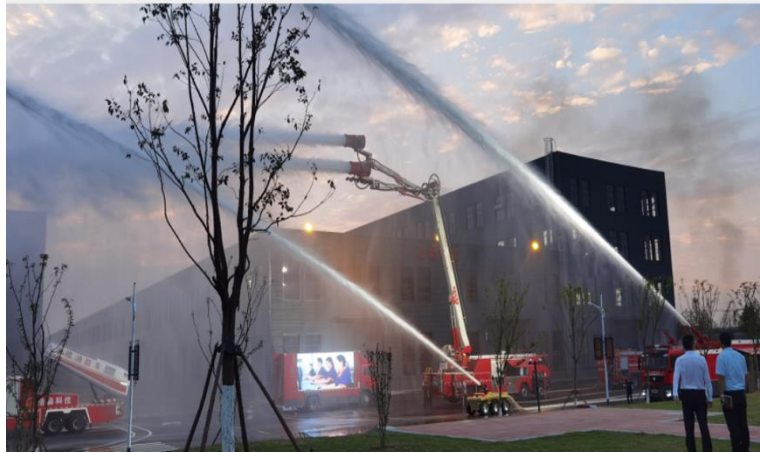
图3 智能应急装备产业园预投产启动仪式

报告期内，公司智能应急救援装备产业园项目主体竣工，部分产线预投产。项目建成后将进一步推动公司数字化转型，提高公司智能化水平，为公司的可持续发展奠定良好的基础。