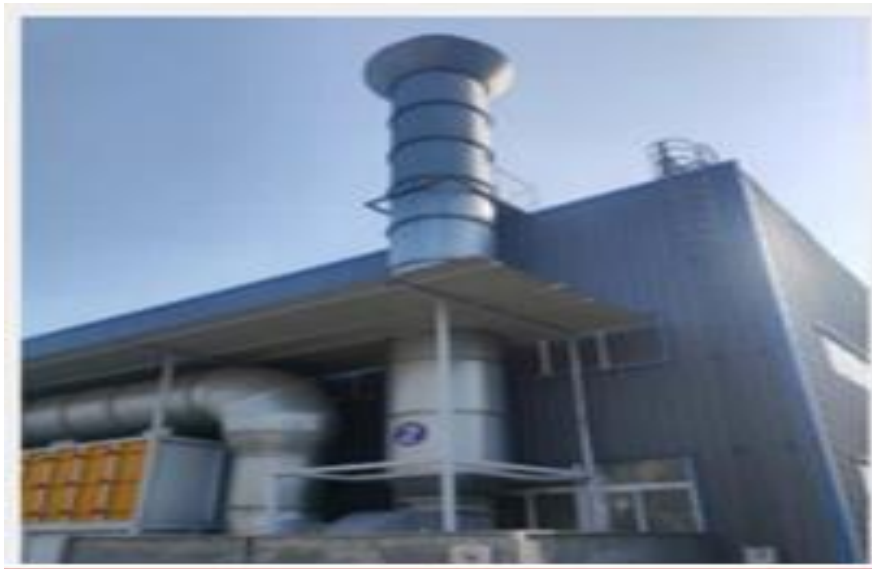
图 6 环保过滤、活性炭吸附装置