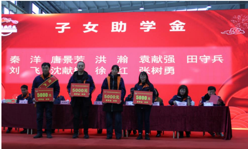
图4 授予浩淼优秀员工子女助学金

公司设置了优秀员工子女奖学金，对在读研究生、本科生和高中生的优秀员工子女分情况发放奖学金；公司积极参与社会上的扶危济困工作，对社会上发生的火灾等紧急情况，积极开展消防救援工作；对社会上的贫困学生、其他困难群体、防疫需要等积极捐助，履行社会责任。报告期内公司对社会捐助37.32万元。