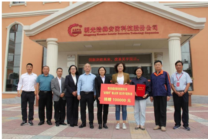
图5 公司捐资助学仪式

公司会持续将承担社会责任与经营发展相结合，充分发挥自身在行业及地区的影响力，回馈社会，为经济社会的可持续发展贡献力量。