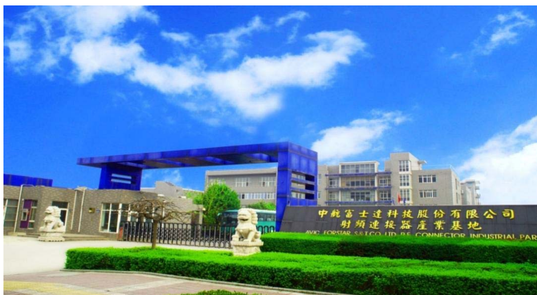
富士达科技园门头

富士达科技园占地 40 亩，目前有综合楼 1 栋、生产楼 2 栋、辅助楼 1 栋，厂区绿植覆盖率高、干净整洁、环境优美、交通便利。