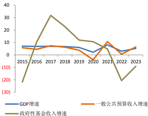
图 2：2015 年以来全国 GDP、一般公共预算收入、政府性基金收入增速（%）