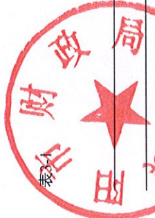
2022年--2023年末4109 濮阳市发行的新增地方政府专项债券情况表