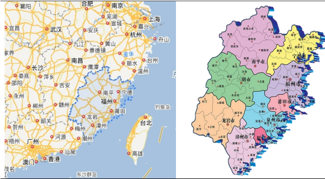
图表 2 福建省区位图