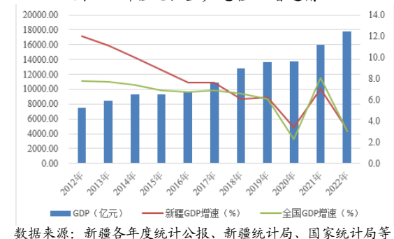
图1 新疆地区生产总值及增速情况

自2012年以来，新疆经济持续发展，经济总量大幅增长，地区生产总值由2012年的7530.32亿元增长至2022年的17741.34亿元，2022年新疆地区生产总值在全国31个省（直辖市、自治区）中排名第23位。2012—2022年，新疆GDP增速走势与全国GDP增速走势基本一致。