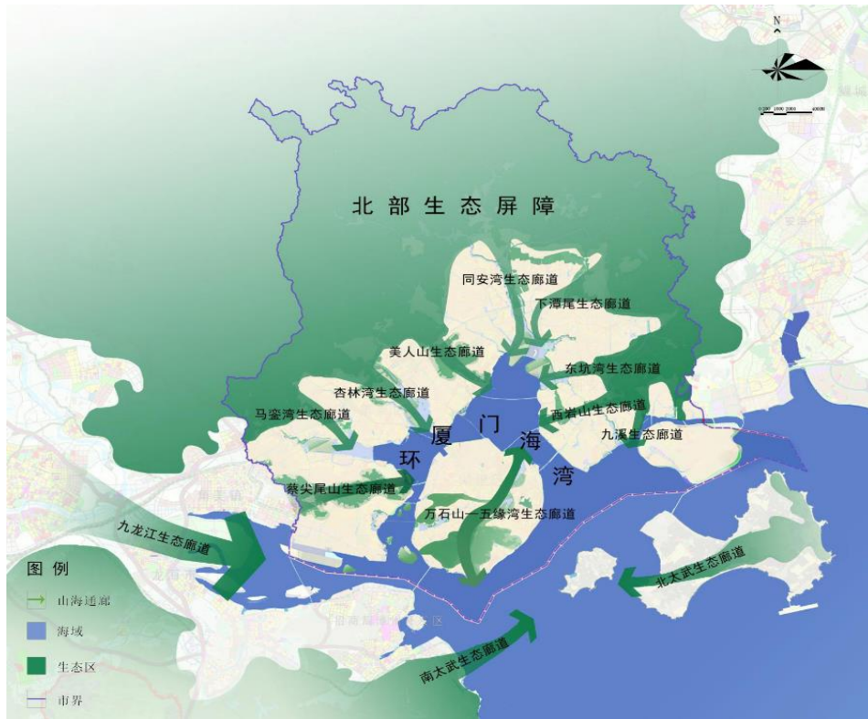
图 7 全域生态格局图

开展滨海岸线整治提升与湿地的生态保护和修复。实施海堤生态化建设和改造，修复受损岸线，提升海岸生态功能和抵御海洋灾害的能力。实行湿地分级管理，完善湿地保护管理体系。保护中华白海豚、文昌鱼、白鹭等珍稀物种，提高生物多样性。