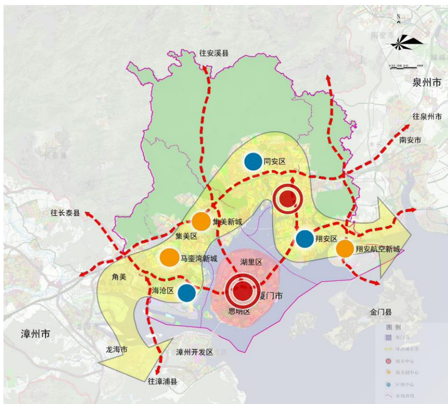
图4 城市空间结构图

发挥集美新城教育科研、交通枢纽、软件信息、文化演艺旅游、高端制造等功能；发挥翔安航空新城国际交通枢纽、物流等功能，辐射带动泉州、金门。强化区级中心的综合服务功能，承载服务各区的公共服务、商业服务、商务办公、创新创业功能，促进岛外功能完善和服务水平提升。