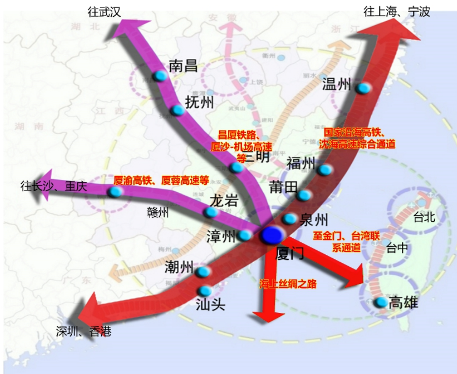
图5 区域空间发展策略图

和海上合作战略支点建设,率先实现与台湾尤其是金门的基础设施应通尽通。西拓:积极拓展内陆腹地空间,促进闽西南区域协同发展,并将腹地空间拓展到南昌、武汉、长沙、重庆等中西部地区。南联:依托高速公路、沿海铁路和海空信息重要港口,实现与粤港澳大湾区联动发展。北延:以重大合作平台为载体,依托沿海高速公路、铁路,积极融入长三角城市群,参与区域分工协作。