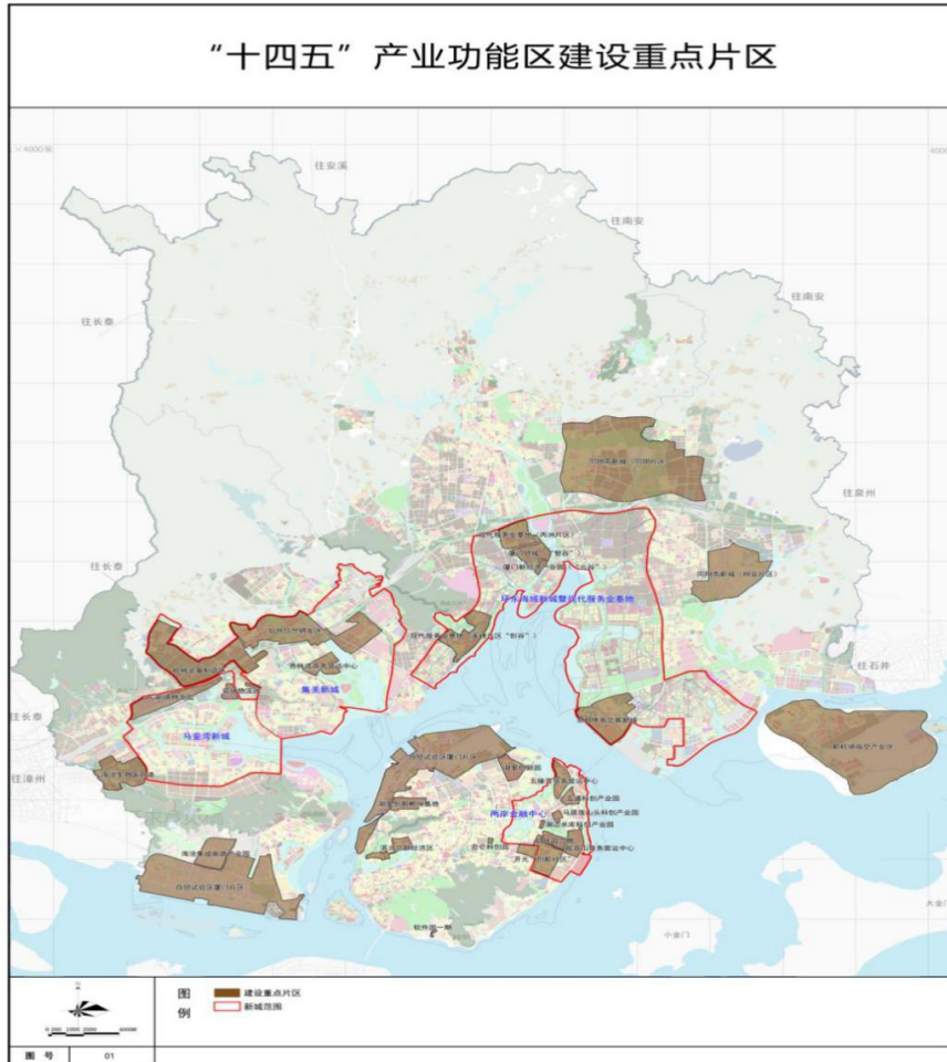
图2 “十四五”产业功能区建设重点片区图

欧厝海洋高新产业园区。打造集科研、创新、孵化、产业为一体的产学研园区，重点引进国内外知名海洋企业总部。