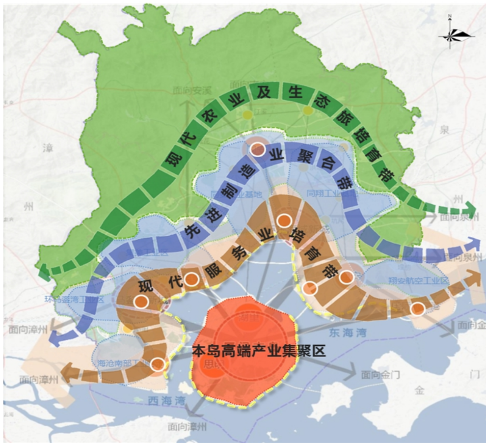
图 1 全市产业布局结构图