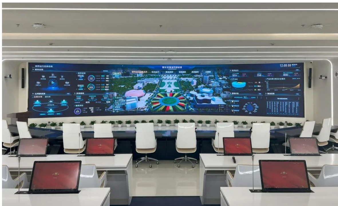
某城市指挥调度大厅

指挥中心、城市大数据中心、城市智慧大脑、生产调度中心等。②会议室：会议市场开始向电信网、广播电视网和计算机通信网融合方向发展，通过传输线路及多媒体设备，将声音、影像及文件资料互传，实现即时互动沟通。主要运用于政府大型会议室、企业会议室、视频会议室等会议中心，还可以应用于培训报告厅等相关应用场景。③商业应用：以多媒体技术来增加参观人员的观赏性和参与性，将声、光、电技术大量应用到内容的呈现，除了可以运用于博物馆、展览馆、规划馆等传统应用场景，还可用于新型数字消费业态，如沉浸式餐厅、游戏互动、全景 KTV 等智能化沉浸式服务体验。