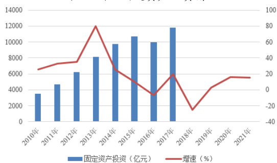
图 2 新疆固定资产投资情况