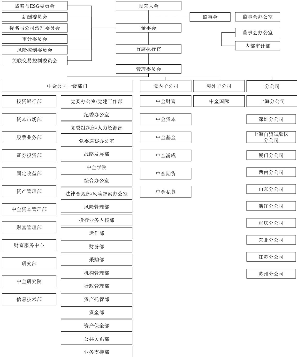
截至 2023 年 3 月末公司组织结构图