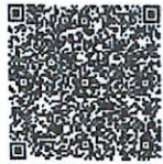
韩频的年检二维码

本证书经检验合格,继续有效一年。 This certificate is valid for another year after this renewal.