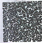
赵健的年检二维码

本证书经检验合格,继续有效一年。 This certificate is valid for another year after this renewal.