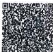
尚博雅年检二维码

本证书经检验合格, 继续有效一年。 This certificate is valid for another year at this renewal.