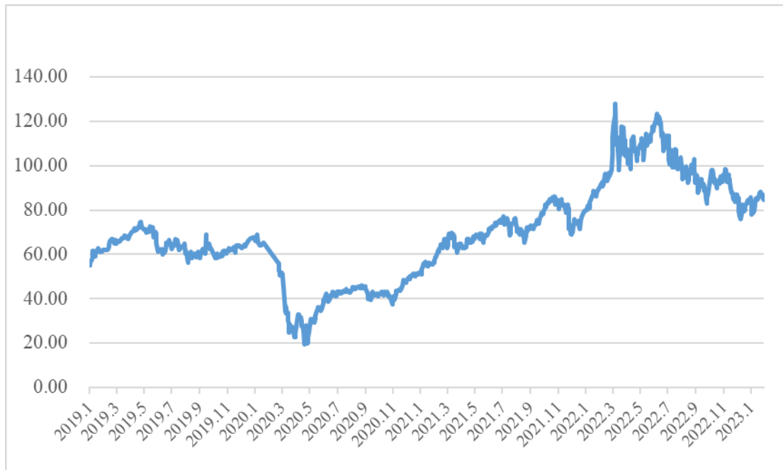
报告期内布伦特原油价格走势情况（美元/桶）

2019-2022 年，受相同因素影响，布伦特原油价格走势与 JKM 一致。2022 年 1-9 月份，布伦特原油均价为 102.33 美元/桶，相比 2021 年度布伦特原油均价 70.30 美元/桶增长幅度为 45.57%，与公司天然气采购成本波动的趋势一致。