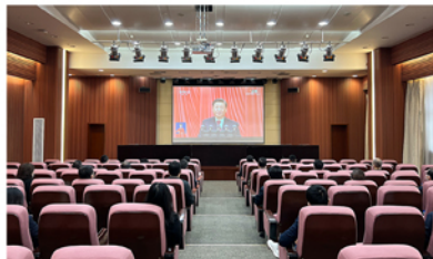
天津城投集团学习宣传贯彻党的二十大精神培训班

坚持把学习宣传贯彻党的二十大精神作为当前和今后一个时期的首要政治任务。第一时间组织各级党组织和广大党员群众收听收看，畅谈体会感想、激发奋进力量。及时召开党委(扩大)会议传达学习党的二十大精神，研究制定工作方案，安排部署学习宣传贯彻落实工作，迅速掀起学习宣传贯彻热潮。集团党委书记示范带头，面向全集团开展专题宣讲，带动两级领导班子和党支部书记宣讲200余场次，深入系统开展培训，聚焦中层以上干部，采取专家解读、上下联动、走访调研、集中研讨等形式，组织110余名党员干部参加为期5天的读书班。聚焦组工干部，采取“组工讲堂”“主题联学”等形式，举办党务干部培训班、党支部书记培训班。聚焦广大一线党员和群众，采取三会一课、主题党日和班前会等形式，对1600余名党员和3600余名职工群众开展全覆盖学习。