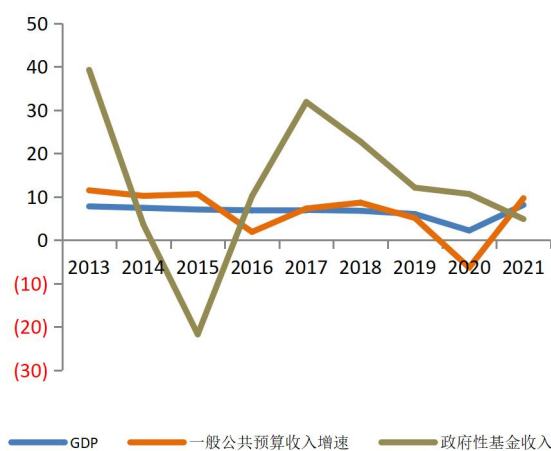
图 2：2013 年以来全国 GDP、一般公共预算收入和政府性基金收入增速（%）