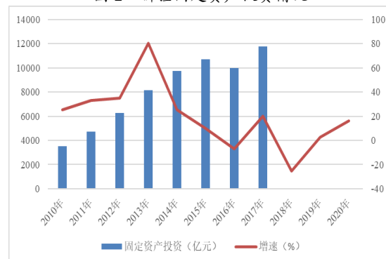
图2 新疆固定资产投资情况

注：2018年起，新疆未披露固定资产投资额的绝对值