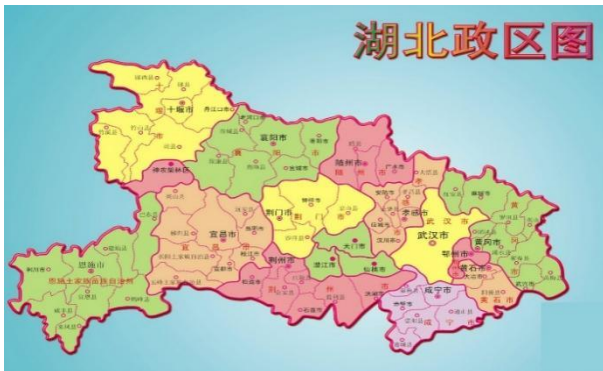
图 1：湖北省行政区划图

湖北省位于我国中部地区，是全国重要的交通枢纽地区，拥有强大的工业基础，是国家提高中部区域经济增长战略规划的重要组成部分，也是国家推行资源节约型和环境友好型社会的试点省份，在全国经济建设中占有重要地位。截至 2020 年末，湖北省下辖 12 个地级市（其中一个副省级市）、1 个自治州和 4 个省直辖县级市。