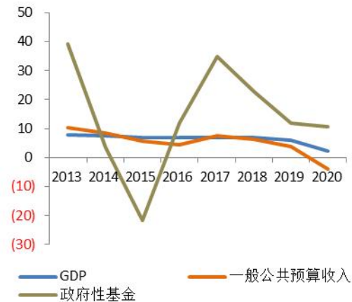
图 2：2013 年以来全国 GDP、一般公共预算收入和政府性基金收入增速（%）