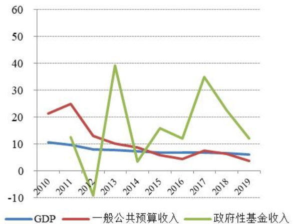
图 2：2010 年以来全国 GDP、一般公共预算收入和政府性基金收入增速（%）