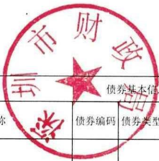
2017年-2019年末发行的新增一般债券情况表（2019年末）