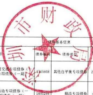
2017年-2019年末发行的新增专项债券情况表（2019年末）