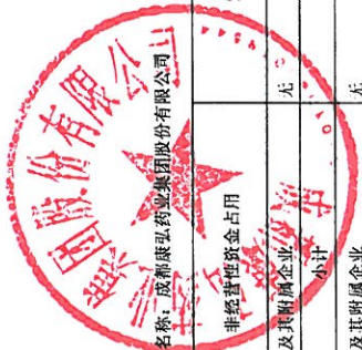
2019年度非经营性资金占用及其他关联资金往来情况汇总表