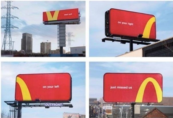
图1、Cossette 为麦当劳打造的“Follow The Arches”户外广告战役，一举斩获户外类广告全场大奖（Outdoor Grand Prix），这也是加拿大本土创意公司十余年来夺得的第一座全场大奖。