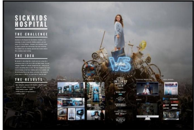
图2、Cossette 的 SickKids 公益项目获得“戛纳创意节 意实效”大奖，此奖项是第一次由加拿大本土公司获得。