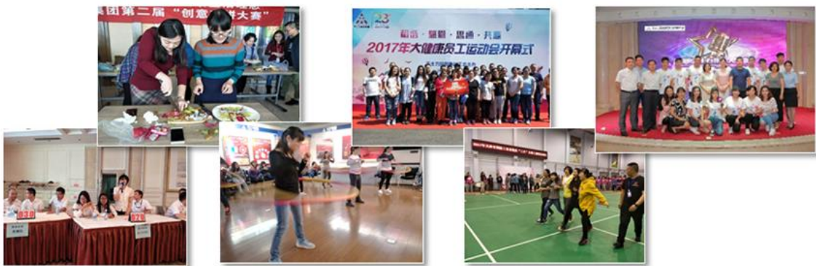
（丰富多彩的员工文化建设）

2017 年围绕和谐卓越员工文化建设，不断创新活动内容和形式，开展了微信平台价值观有奖竞答、冷拼大赛、宝宝大赛、女员工运动会、“最美劳动瞬间”摄影大赛、大健康知识竞赛等活动，组织员工参加了国防系统女工趣味运动会、军歌大赛、“天士力好声音”歌手大赛、趣味运动会等，得到了员工的积极响应和热情参与，超过 2700 人次参与，员工身心都得到放松的同时，弘扬了大健康理念。关注困难员工，设立困难员工健康档案，建立妈咪小屋和职工小家，使员工体会到公司的关爱和家一般的温暖。