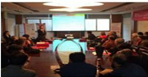
陕西西安于莲湖区北院门庙后街患者教育