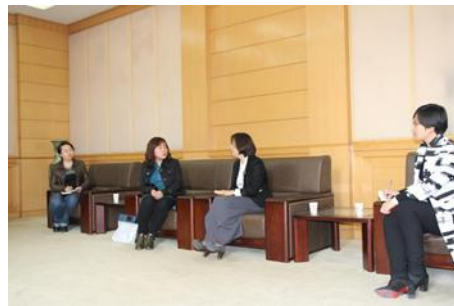
（此图为天士力在中医药大学做就业辅导的情况）

在产业发展过程中，公司以自身的产业特点促进和带动区域特色产业发展，创造就业机会，提高区域就业率。公司通过组织新生宣介及校园招聘、企业参观、就业见习等方式，积极与高校互动；公司还通过创新联盟的合作方式与外部高校、研究机构共同承担省部级的项目推动工作。