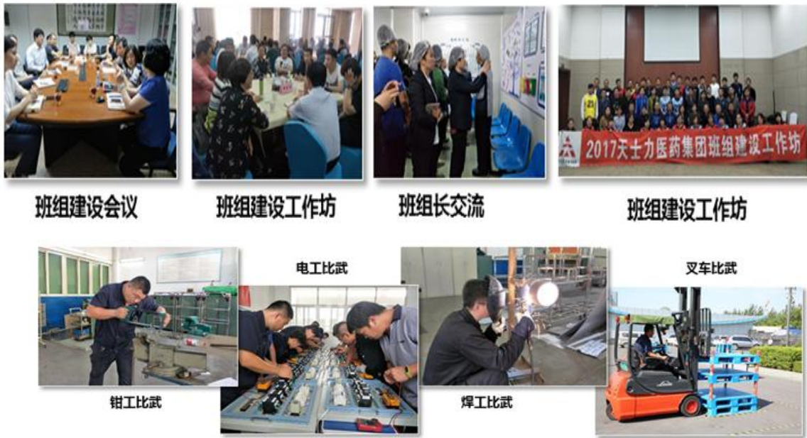
(和谐高效的班组建设及沟通渠道建设)

过一线班组长管理技能培训、多技能员工培养，及多种形式的技能比武增强员工自信心，形成积极向上的良好氛围；在沟通渠道建设方面，通过微信公众平台及时向一线班组长和员工推送公司最新战略、班组管理、健康养生知识、活动信息，继续推进一线员工代表座谈会、晨会晚会制度、创新多形式看板、班组长培训及班组建设交流活动，为一线班组长提供班组建设的理论支持，为员工打造更多交流平台，提升班组凝聚力。