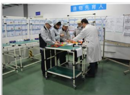
（图片为人才发展项目系列活动）