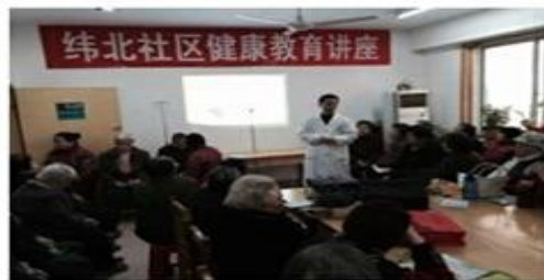
山东济南纬北社区患者教育