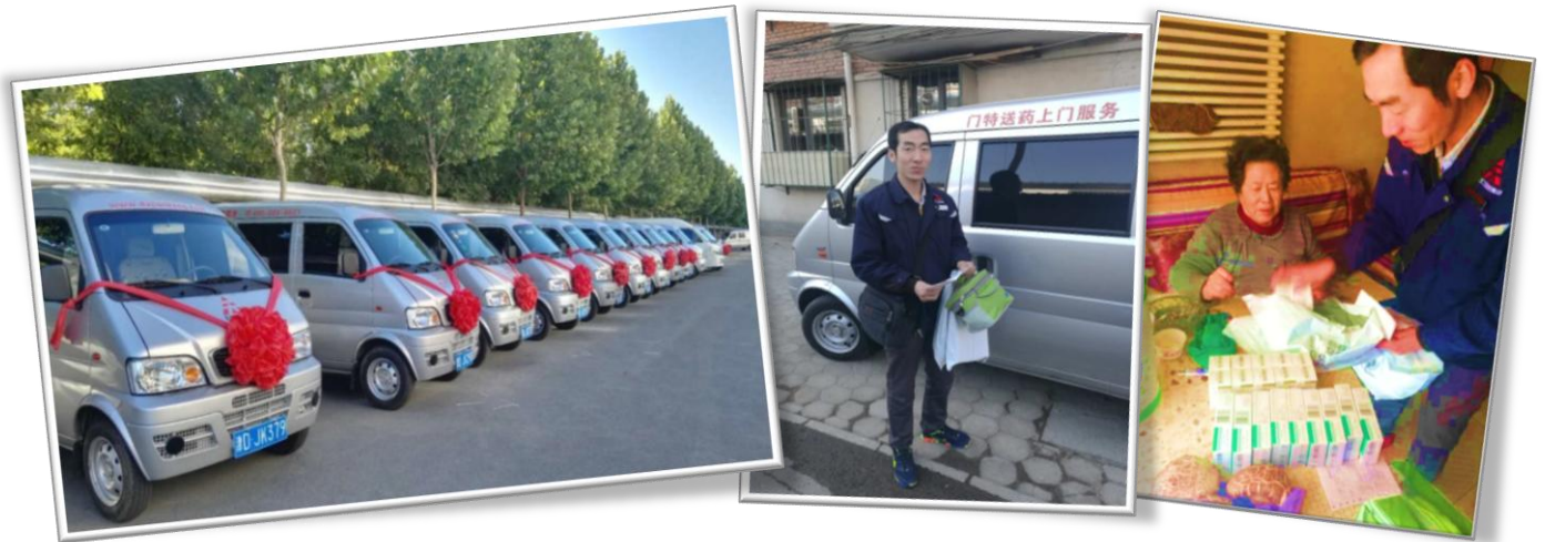
(此图为天士力糖尿病门诊特殊病患者用药服务配送情况)