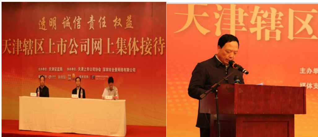
（此图为业绩说明会现场照片）

2017 年 5 月，公司参加了以“透明、沟通、诚信、回报”为主题的天津辖区上市公司 2015 年年报业绩网上集体说明会暨投资者集体接待日活动。整个活动采取视频直播、文字交流、现场图片等方式进行网络直播，期间高管与随行工作人员一起就 2016 年年报、公司治理、发展战略、经营状况、非公开发行项目、国际化进程、持续发展等投资者关心的问题，细致耐心的逐条给予回复。此次投资者沟通交流活动缩短了投资者与上市公司之间的距离，更加有效地促进两者间形成的良性互动双赢关系，从而推动实现公司价值和股东利益最大化。