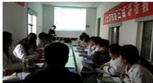
山东茌平县乐平镇卫生院医生培训