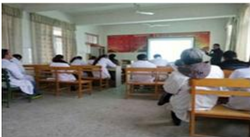
山东省成武县张楼乡卫生院医生培训

多年来深入全国各省市县卫生院、社区等一线地区，面对面开展医生培训、患者教育讲座等公益活动，主动为患者提供专业咨询，为民众的健康做出企业的贡献。